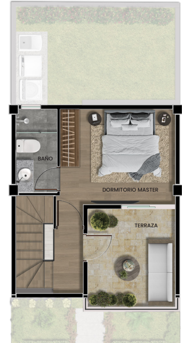
Planta alta 2

Área cubierta: 23.60m 2 Terraza: 8.93m 2 Balcón: 3.73m 2