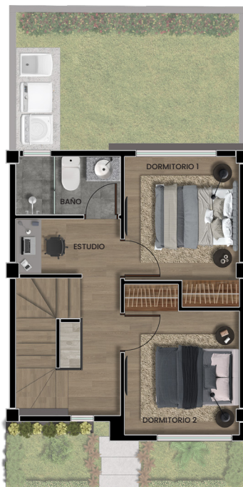
Planta alta 1

Área cubierta: 32.19m 2 Patio posterior: 16.49m 2 Patio frontal: 7.84m 2