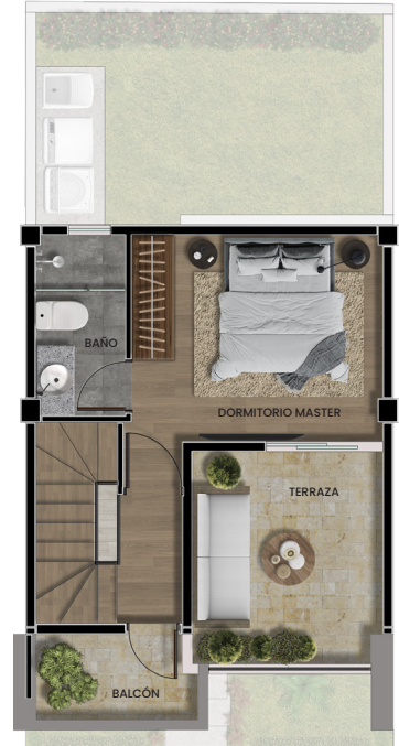
Planta alta 2

Área cubierta: 23.96m 2 Terraza: 9.10m 2