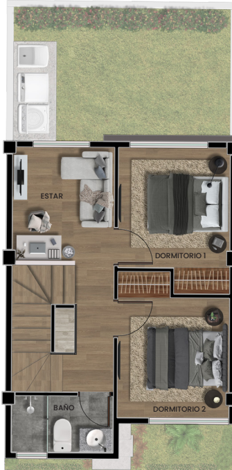
Planta alta 1

Área cubierta: 32.19m 2 Patio posterior: 16.48m 2 Patio frontal: 6.65m 2